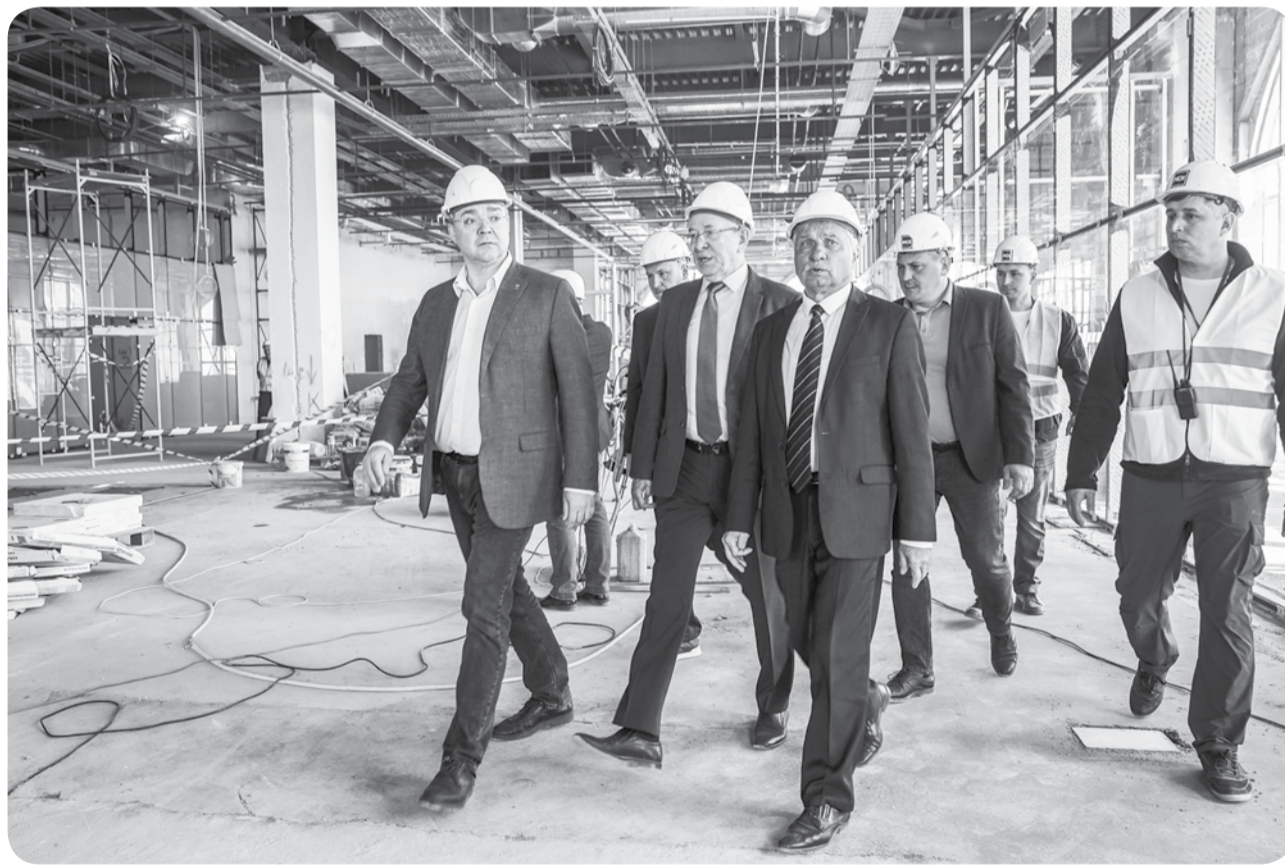
Губернатор Владимир Владимиров проинспектировал ход строительства аэровокзального комплекса аэропорта Ставрополь.

РАБОТЫ ПО СТРОИТЕЛЬСТВУ НОВОГО АЭРОВОКЗАЛЬНОГО КОМПЛЕКСА НАХОДЯТСЯ В СТАДИИ ЗАВЕРШЕНИЯ