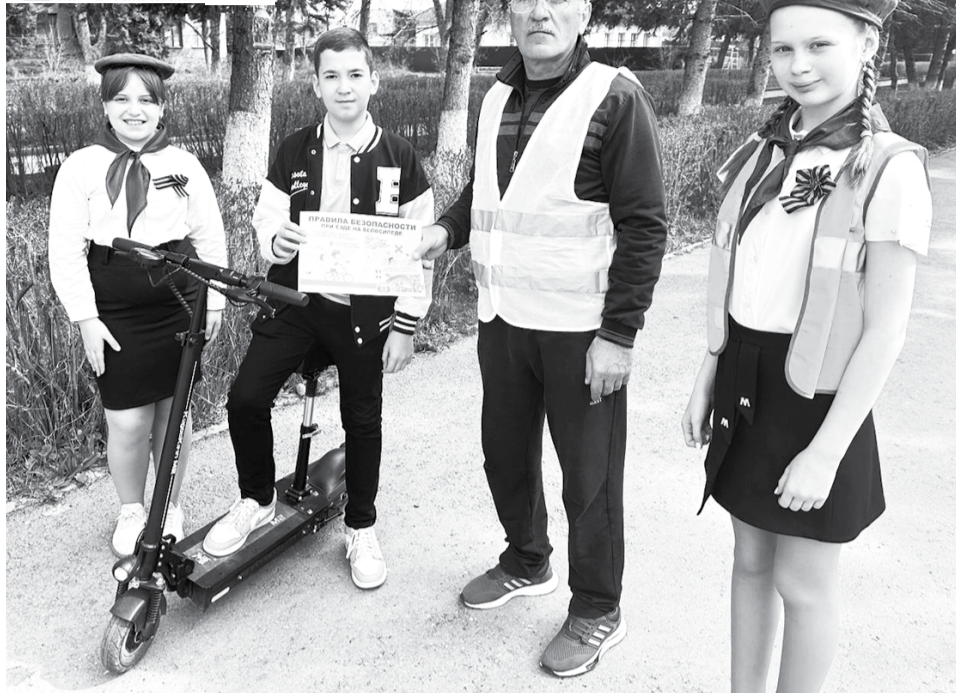
Обучение юных жителей округа правилам катания на средствах индивидуальной мобильности и мерам безопасного вождения велосипедом проводится с помощью индивидуальных бесед и вручения специальных информационных буклетов.